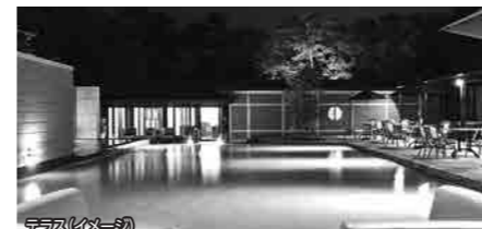
ラウンジ(イメージ)

3500坪の敷地にわずか17室という、別府湾を望む極上のリゾート。2019年新たに新設されたお部屋です。全室がオーシャンビュー&海を見ながら寛げるビューバス付き。時間により刻々と表情を変える別府湾を眺めながら上質なプライベートステイをお楽しみください。