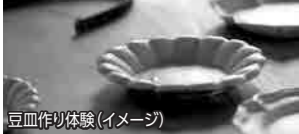
豆皿作り体験(イメージ)