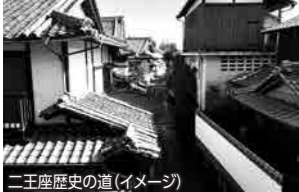
二王座歴史の道(イメージ)