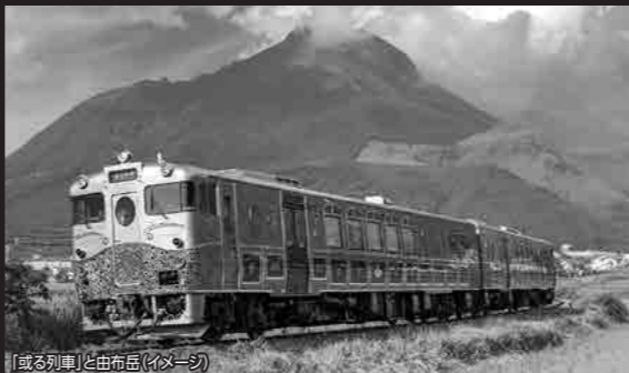
「或る列車」と由布岳(イメージ)