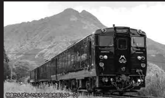
特急かんぱち・いちろくと由布岳(イメージ)