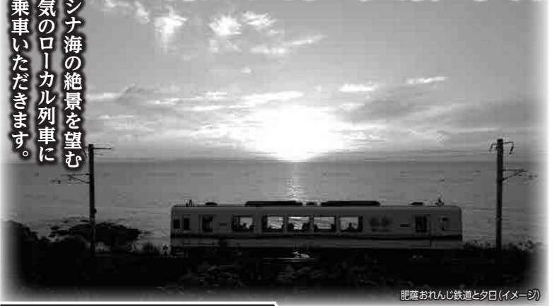
肥薩おれんじ鉄道と夕日(イメージ)

おとなの旅が楽しめる 特急A列車で行こうに乗り 東シナ海の夕景と世界遺産の島・天草をめぐる旅