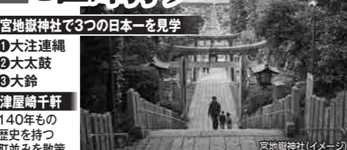
宮地嶽神社(イメージ)

宮地嶽神社で3つの日本一を見学 ①大注連縄 ②大太鼓 ③大鈴 津屋崎千軒 140年もの歴史を持つ町並みを散策。