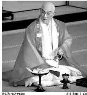
製作:松竹楼 市川團十郎

市川海老蔵が十三代目市川團十郎白猿を襲名して約2年。九代目團十郎が初演し、代々の團十郎に受け継がれてきた豪華な演目で十三代目の襲名披露巡業の最後を飾ります。当ツアーでは一等席22枚を確保しました。口上や祝祭気分溢れた舞踊、黙阿弥らしい七五調のせりふが聴きどころの「河内山」など見どころ満載です。