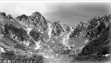
千畳敷カール(イメージ)