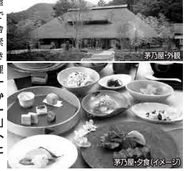
茅乃舎・夕食(イメージ)

なかなか予約が取れない人気の名店「御料理 茅乃舎」でご夕食を楽します。茅葺屋根の風情ある別館で味合うのは、茅乃舎の「だし」を使い、素材の美味しさが引き出されたコース料理です。メインは、「十穀鍋(2名様以上から)」「嘉穂牛ソテー」「トマトバターソース」「嘉穂牛のローストビーフ」から事前にお選びください。