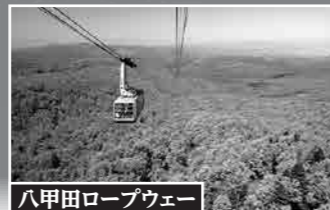
八甲田ロープウェー ロープウェーで八甲田山山頂へ。高山植物の宝庫「八甲田ゴードライン」をハイキング。

世界自然遺産 白神山地 青森から秋田にまたがる13万haの広大な白神山地。その内、ブナ林で占められた16.91haが1993年に世界遺産に指定されました。この人為の影響をほとんど受けていないブナの天然林の規模は世界最大級。今回のツアーでは、ブナの原生林の中、世界遺産指定区域の暗門第3の滝まで専門の解説員の案内を聞きながら歩きます。※暗門第3の滝までは足場の悪い道がございますのでトレッキングシューズが必要になります。足に自信がない方は初級者向け「ブナ林散策」コースへご案内します。