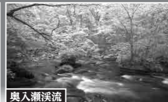
奥入瀬溪流 1日目、緑に覆われた「奥入瀬溪流」を各自のペースで散策をお楽しみください。

貴重な「縄文時代の遺跡」を見学 世界文化遺産「北海道・東北の縄文遺跡群」に指定された2つの遺跡にご案内します。