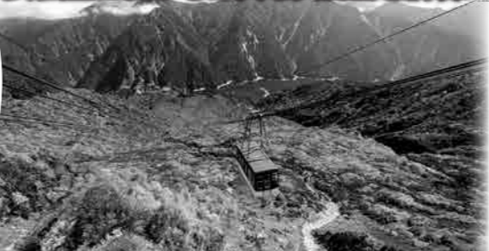
立山ロープウェイ (紅葉の見頃:9月中旬~10月上旬)

立山黒部アルペンルートは、標高3,000m級の北アルプスの峰々が連なる世界有数の山岳観光ルートです。いくつもの乗り物を使いながら、期間限定の黒部ダム観光放水など壮大な景観をお楽しみいただけます。