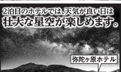
2泊目のホテルでは、天気の良い日は壮大な星空が楽しめます。

■食事/朝食2回・昼食3回・夕食2回 ■宿泊先/(1泊目・大町温泉)ANAホリデイイン・リゾート信濃大町くろよん、(2泊目・弥陀ヶ原)弥陀ヶ原ホテル ■添乗員/同行します ■最少催行人員/7名 ■利用バス会社/西日本ジェイアールバス又は北陸エリア利用バス会社 スケジュール 0 福岡空港 [7:20] 小松空港=(和御膳のご昼食)=白馬マウンテンハーバー(ゴンドラリフトで白馬三山を望む絶景テラスへ)=大町温泉(泊) ①ホテル=扇沢=(関越トンネル電気バス)=黒部ダム・黒部湖++(2)黒部ケーブルカー++黒部平++(3)立山ロープウェイ++大観峰=(4)トンネルトローパス)=室堂(白海老の松花堂弁当のご昼食/室堂を散策)=(5)立山黒部アルペンバス=弥陀ヶ原(泊) ②ホテル=(6)立山黒部アルペンバス=美女平++(7)立山黒部アルペンバス++立山=(富山湾朝のご昼食)=小松空港→福岡空港 [17:50]