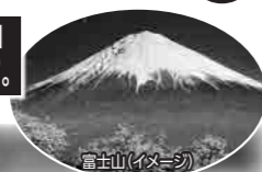
富士山で来光(イメージ)

1日目は、新七合目の「山室・御来光山荘」に18時頃に到着予定。山小屋ですが個室をご用意。2日目登頂後は下山せずに標高3,090mの山小屋砂走館(又は3,300mの赤岩八合館)にもう1泊します。2日間かけての登山なので初心者の方も安心です。