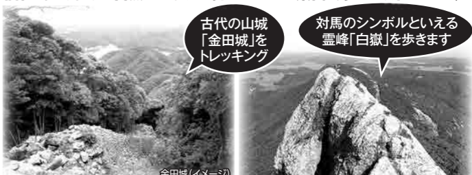
金田城(イメージ) 白嶽(イメージ)

NHKの番組「日本最強の城スペシャル」で日本最強の城に選出された古代の山城まで歩きます。