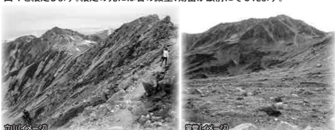
立山(イメージ) 室堂(イメージ)

立山三山とは「雄山(3003m)」、「大汝山(3015m)」、「富士ノ折立(2999m)」を言います。黒部立山アルペンルートを通り、登山口でもある室堂を起点に立山の山々を縦走します。縦走の先には岩の殿堂、朝岳が眼前にそびえます。