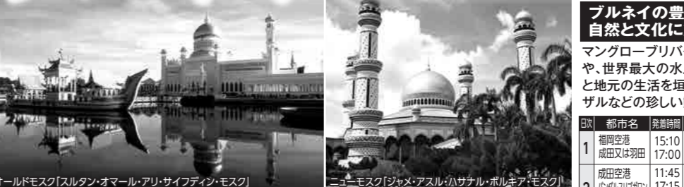
オールドモスク「スルタン・オマル・アリ・サイフディン・モスク」