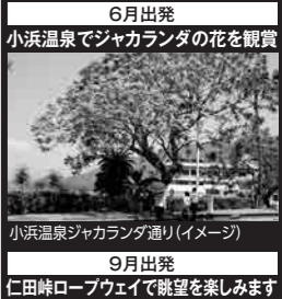
6月出発 小浜温泉でジャカラダの花を観賞

スケジュール 0 博多駅築紫口[9:20]=竹崎公園(園(その)竹崎公園定食のご昼食)=(謙早湾干拓堤防道路)=6月:小浜温泉(ジャカラダ観賞)/9月:仁田峠(ロープウェイで展望台に上り雄大な眺望を楽しみます)=雲仙温泉(泊) ※ご希望の方は地獄めぐりへご案内 0 ホテル=島原城・武家屋敷通り=湧水庭園 四明荘(見学)⇔(具雑煮のご昼食)=博多駅[17:00] ※花の見頃は気候状況により異なる場合がございます。