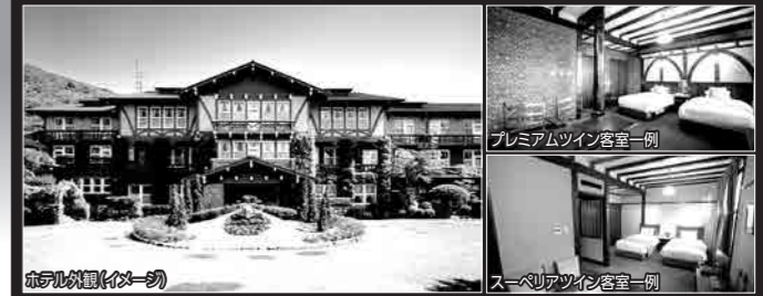
ホテル外観(夕べ時)