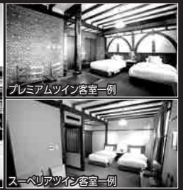
プレミアムツイン客室一例