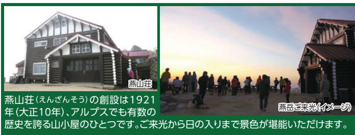
燕山荘(えんざんそう)の創設は1921年(大正10年)、アルプスでも有数の歴史を誇る山小屋のひとつです。ご来光から日の入りまで景色が堪能いただけます。