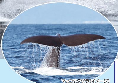
マッコウクジラ(イメージ)