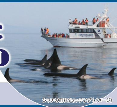
シャチの群れウォッチング(イメージ)