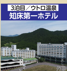
3泊目/ウトロ温泉 知床第一ホテル