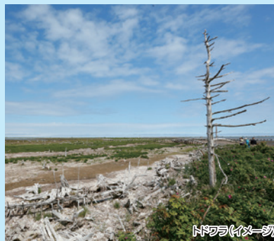
トドワラ(イメージ)

知床、根室の両半島の間に位置する野付半島からは知床連山～阿寒まで続く山々、北方領土の国後島を望めます。アザラシ、野鳥などを観ながら、立ち枯れた木々の風景が有名な「トドワラ」までクルージングを楽しみます。さらに、トドワラ木道からの遊歩道をハマナス、エゾカンゾウなどのお花畑を眺めながら歩きます。