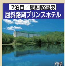
2泊目/屈斜路温泉 屈斜路湖プリンスホテル