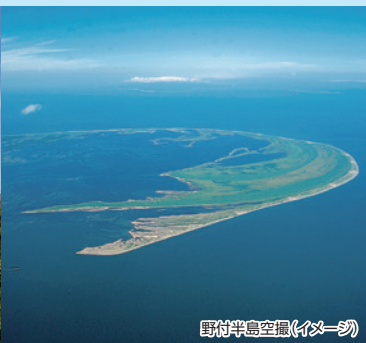
野付半島空撮(イメージ)