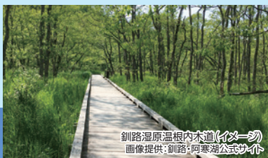
釧路湿原温根内木道(イメージ)

釧路湿原内で唯一、湿原内を歩ける木道がある「温根内(おんねい)木道」を歩きます。(約3km)