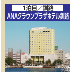
1泊目/釧路 ANAクラウンプラザホテル釧路