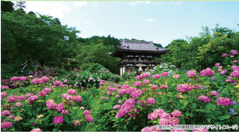
1番札所・丹州華観音寺のアジサイ(イメージ)