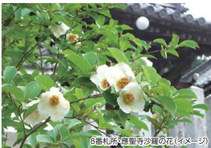
8番札所・應聖寺沙羅の花(イメージ)