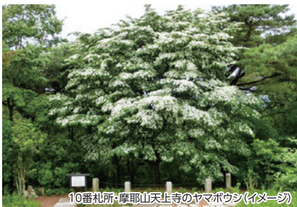
10番札所・摩耶山天上寺のヤマボウシ(イメージ)