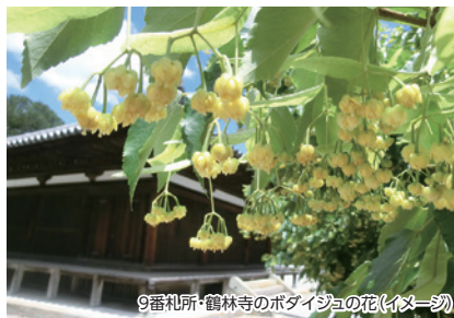
9番札所・鶴林寺のボダイジュの花(イメージ)