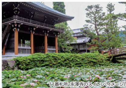
11番札所・永澤寺のスレシ(イメージ)