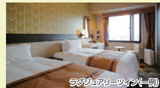
ラグジュアリーツイン(一例)