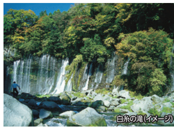
白糸の滝(イメージ)