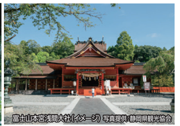
富士山本宮浅間大社(イメージ)