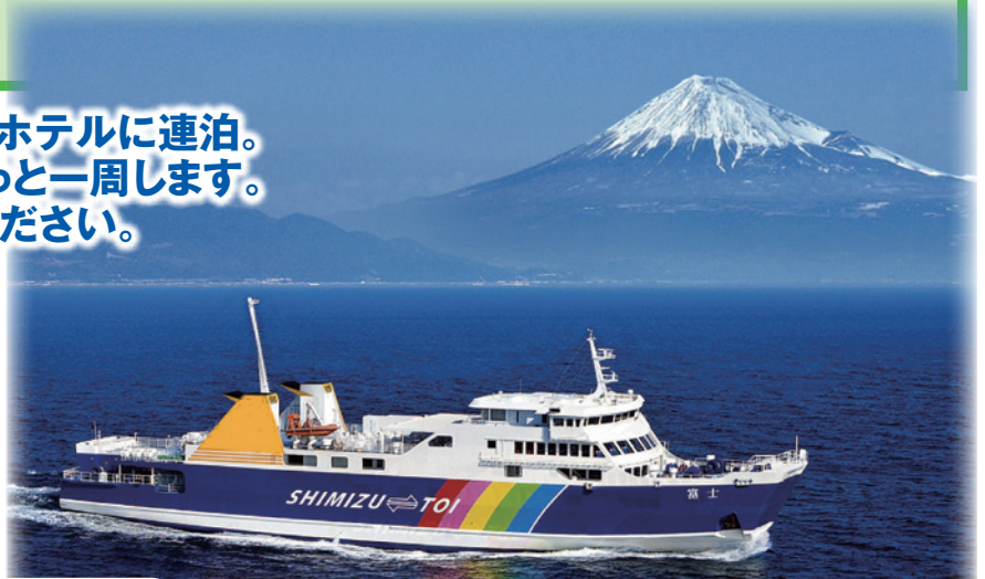
富士山を望む駿河湾クルーズ(イメージ)