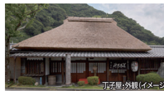
丁子屋・外観(イメージ)

東海道20番目の宿場町の丸子宿で1596年(慶長元年)創業。十返舎一九や歌川広重の作品にも登場した、名物の「とろろ汁」をお召し上がりください。