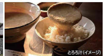
とろろ汁(イメージ)