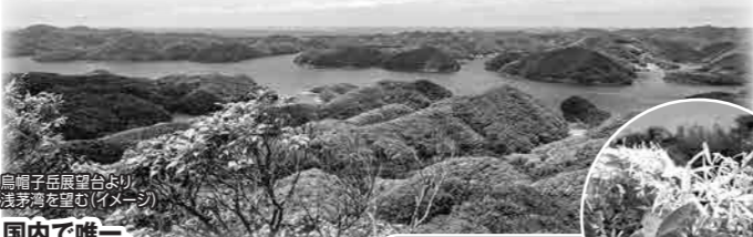
鳥帽子岳展望台より浅茅湾を望む(イメージ)

韓国・釜山まで約50km。「国境の島」として、独自の文化を育ててきた対馬の史跡と、紺碧の海に囲まれた豊かな自然の風景をめぐります。