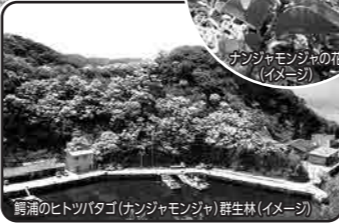
鯉浦のヒトツバタゴ(ナンジャモンジャ)群生林(イメージ)

国内で唯一、ナンジャモンジャの花が咲き乱れる風景をご覧ください。4月下旬から5月上旬にかけて「ヒトツバタゴ」(別名「ナンジャモンジャ」の花/モクセイ科)が対馬の最北端・鯉浦を取り巻く三方の丘陵の全斜面に咲き誇ります。国内では、このような大規模な群生が見られるのはここだけです。