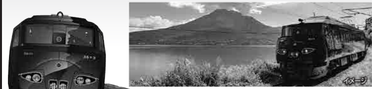
Design & Illustration by Eiji Mitooka + DDA

「走る九州」をテーマとした、JR九州のD&S列車「36ぷらす3」に乗って、九州の「食」・「温泉」・「自然」・「歴史」などの魅力を存分に楽しみながら、ぐるっと九州を一周。プライベートな個室車両の贅沢な空間の中、優雅に列車の旅をお楽しみください。毎日のご昼食は、地元の食材を中心とした名店の味を車内でご堪能いただけます。