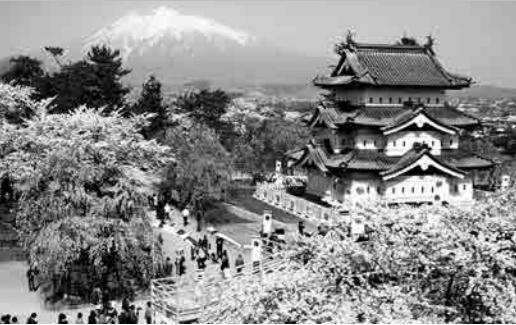
弘前公園 染井吉野を中心に、枝垂桜、八重桜など、52種類約2,600本の桜が咲き誇ります。