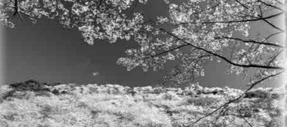
花立山(花立公園) (イメージ)