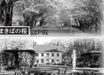
英国式庭園 (イメージ)