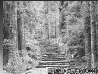
熊野古道・大門坂 (イメージ)

2日目は、世界遺産「熊野古道」観光。熊野古道の中でも、当時の面影を美しく残している「大門坂」へ。石畳と老杉に囲まれる荘厳な雰囲気です。落差133mの「那智の滝」、熊野三山の一つ「熊野速玉大社」などにもご案内します。