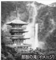
那智の滝 (イメージ)

1泊目のお宿は、名湯「白浜温泉」の温泉リゾートホテル「南紀白浜マリOTTホテル」。温泉ビューバス付プレミアムルームでゆったりとお寛ぎいただけます。ご夕食は南紀の海の幸など旬の食材を使った和洋折衷コース料理をお楽しみください。