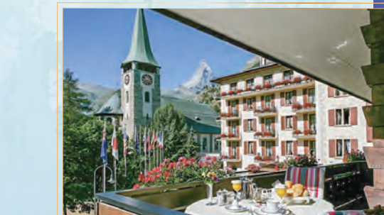
クラシックルーム マッターホルンビュー(20㎡)

静かなロケーションに位置し、有名なアイガー北壁とヴェッターホルンの美しい自然のパノラマを楽しめます。