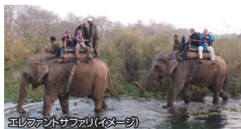
エレファントサファリ(イメージ)

世界自然遺産「チトワン国立公園」では “エレファントサファリ”や“ジャングル ウォーク”をお楽しみいただけます。