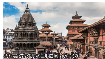
カトマンズ・ダルパール広場(イメージ)

世界自然遺産「チトワン国立公園」では “エレファントサファリ”や“ジャングル ウォーク”をお楽しみいただけます。