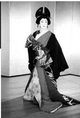
坂東 玉三郎

演目 口上~女方の魅力~ ・黒髪(くろかみ) ・由縁の月(ゆかりのつき)他 ※演目順は未定です。お話を踊りなどをお楽しみください。