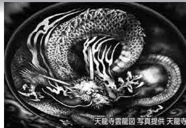
天龍寺雲龍園

太秦映画村の俳優による十目おびす宝恵かども楽しみ 古都で招福・干支めぐり 2日間 催行決定間近