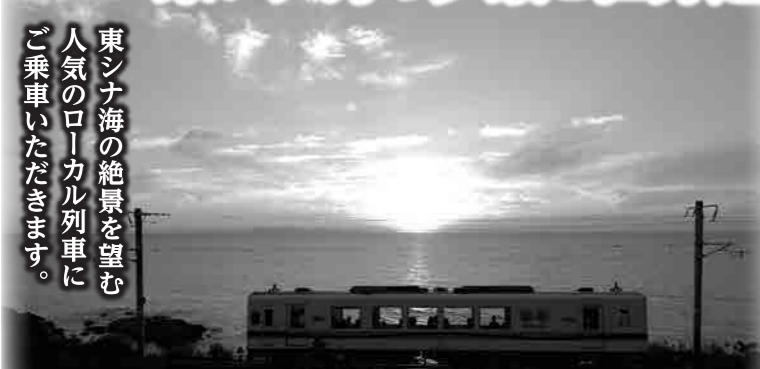
肥薩おれんじ鉄道と夕日(イメージ)