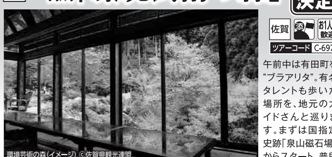
環境芸術の森(イメージ)