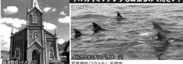
崎津教会(イメージ)