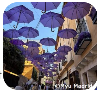
→ スペイン ブリウエガ村