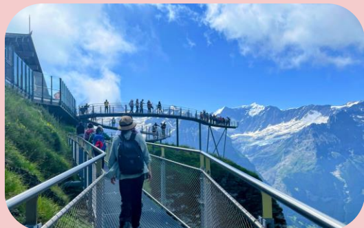
↑ フィルスト・クリフウォーク

7月中旬にユングフラウ鉄道グループ様主催のスイスFAMに参加し、インターラーケンをベースにベストシーズンのスイスを訪問してきました。