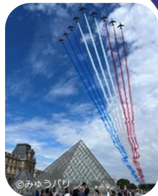
↑ パリ祭 14 Juillet 2023