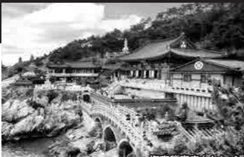
海東龍宮寺(イ・イジン)

■食事/朝2回・昼2回・夜2回 ※有効期限が2023年10月9日以降の旅程(バス ポート)が必要です。査証(ビザ)は取得不要です。 ※博多・釜山では出入国審査がございます。 ※7 月9日博多では入国・税関審査の関係で下船にお時 間を要します。帰路(航空券・鉄道等)に手配をされ るお客様は長時間に十分な余裕をお持ちください。