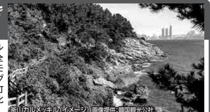
釜山カルメツキル(イメージ)

「カルメツキル」とは「カルメ(カモメ)」、「キル(道)」となり、「カモメの道」という意味です。全長263.8kmを9つのコースに分けており、カモメの飛び交う姿を見ながら海辺のウォーキングをお楽しみください。その後は、カラフルな町並みで、アートな街として知られる「甘川文化村」を観光いたします。