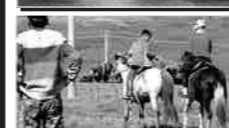
テレルジでは乗馬体験も。

モンゴル伝統のゲルを基調としたコテージタイプのホテル。見渡す限りどこまでも広がる大草原と満天の星の下、安らぎとラグジュアリーなひとときをお過ごしいただけます。