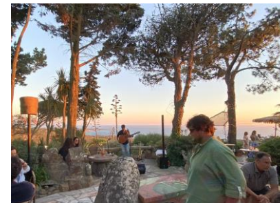
ロカ岬近くの絶景バー