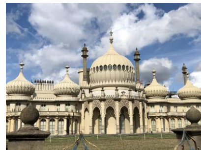
ブライトン ロイヤル・パビリオン