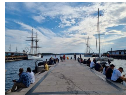
市庁舎前の埠頭で一休みする人たち