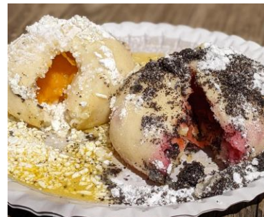
オヴォツネー・クネドリーク (フルーツ入り団子)