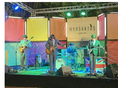
リスボン ディナーの生演奏