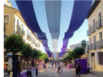
ラベンダー・フェスティバル