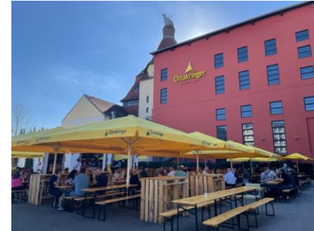
オッタクリンガー醸造所 ビールフェスティバル