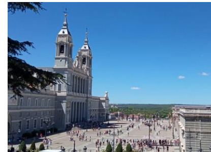
マドリッドアルムデナ大聖堂