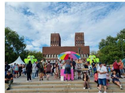
市庁舎前広場のフェスティバル