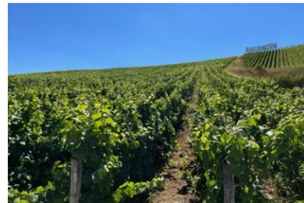
シャンパーニュ地方のブドウ畑