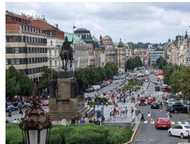
ヴァーツラフ広場

日本国籍の場合、あらゆる180日間の期間内で90日以内の観光目的の滞在はビザ不要。 ※滞在可能日数についてはシェンゲン協定加盟国への渡航を参照。他のシェンゲン協定加盟国を訪問する場合、訪問国の無査証滞在の条件にも注意する。