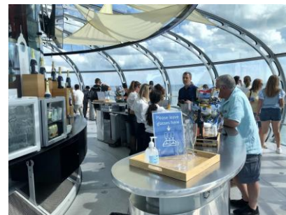
ブライトン British Airways i360 内部